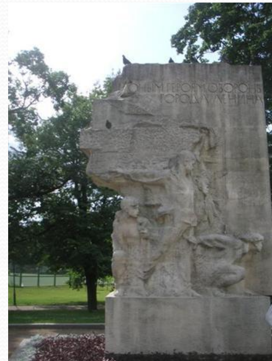
Памятник пионерам- героям, погибшим в Великой Отечественной Войне, Санкт-Петербург, Таврический сад