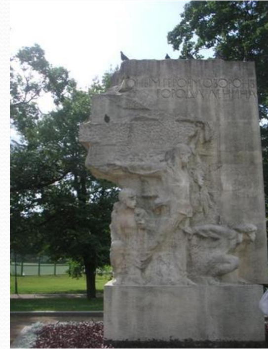
Памятник пионерам- героям, погибшим в Великой Отечественной Войне, Санкт-Петербург, Таврический сад