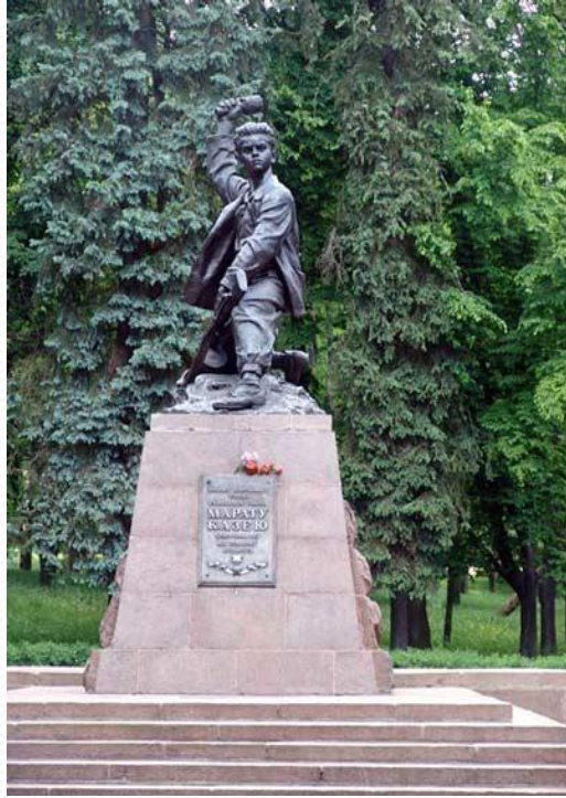
Памятник Марату Казею в г. Минске (Беларусь)