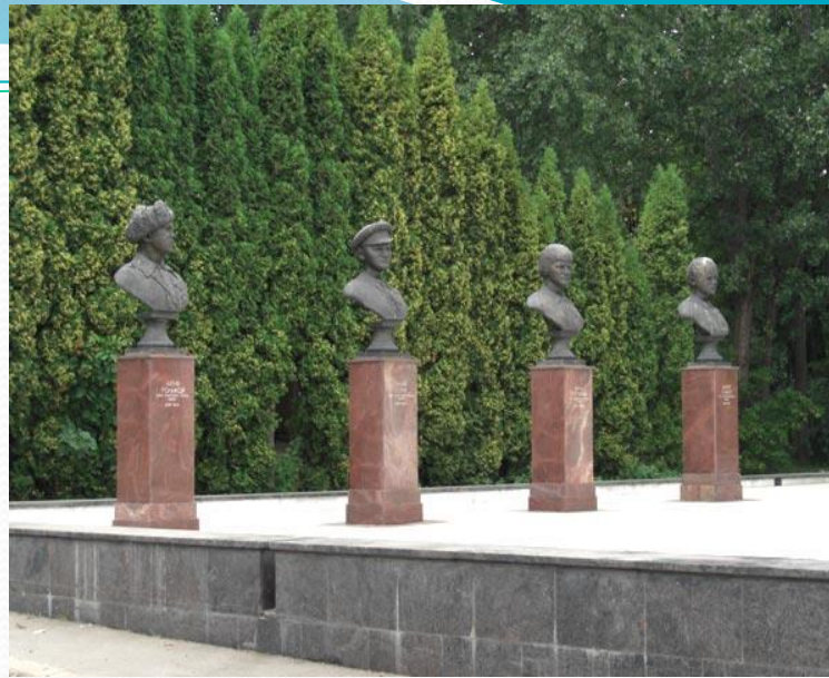
Памятник пионерам- героям, погибшим в Великой Отечественной Войне, Москва, ВДНХ