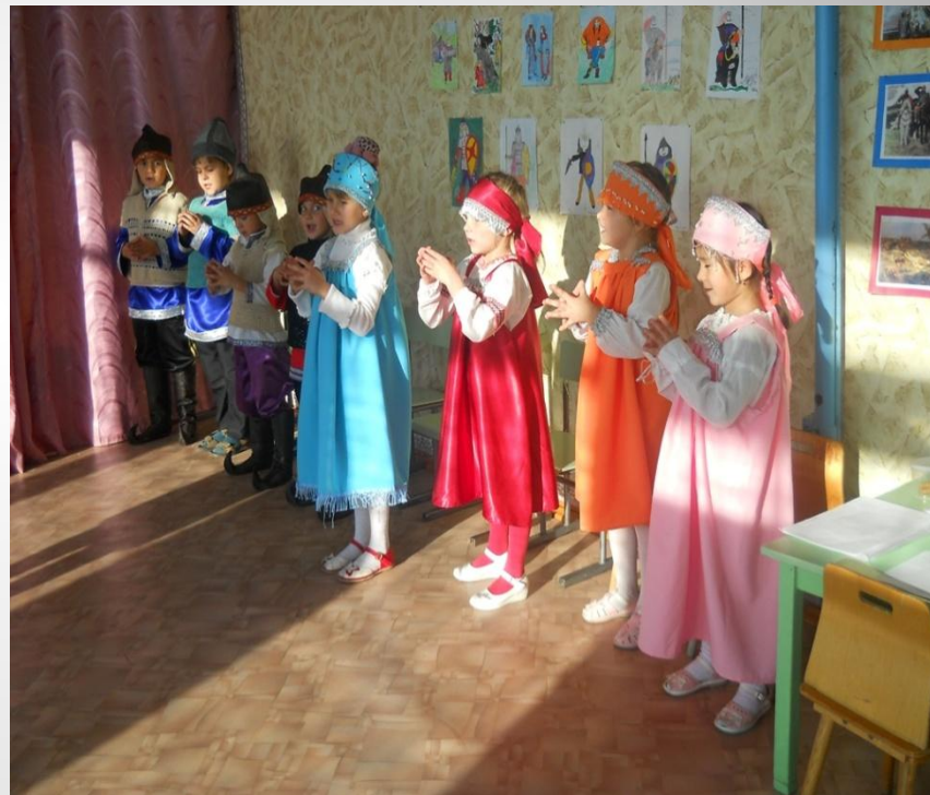
Утренник « Богатыри земли русской »