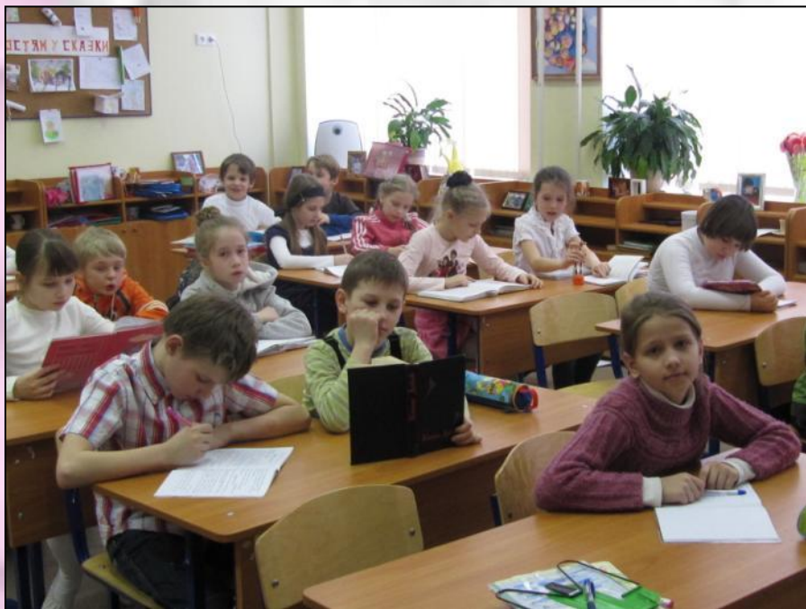
класс без формы