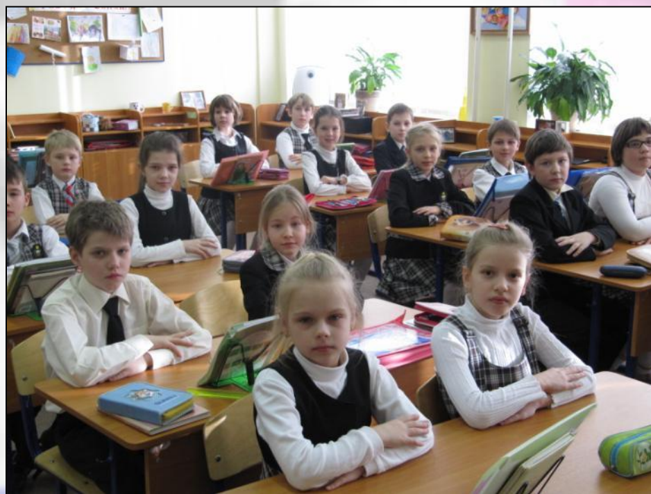
класс в школьной форме