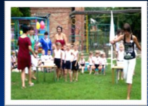
Дни открытых дверей