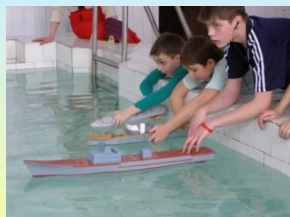
Модельные виды спорта