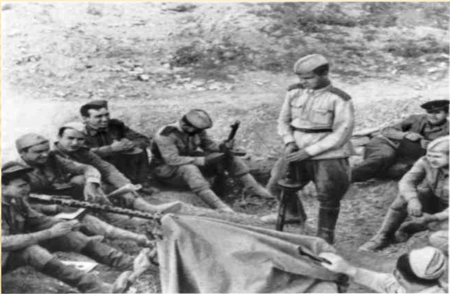
Партийное собрание в пулемётной роте.