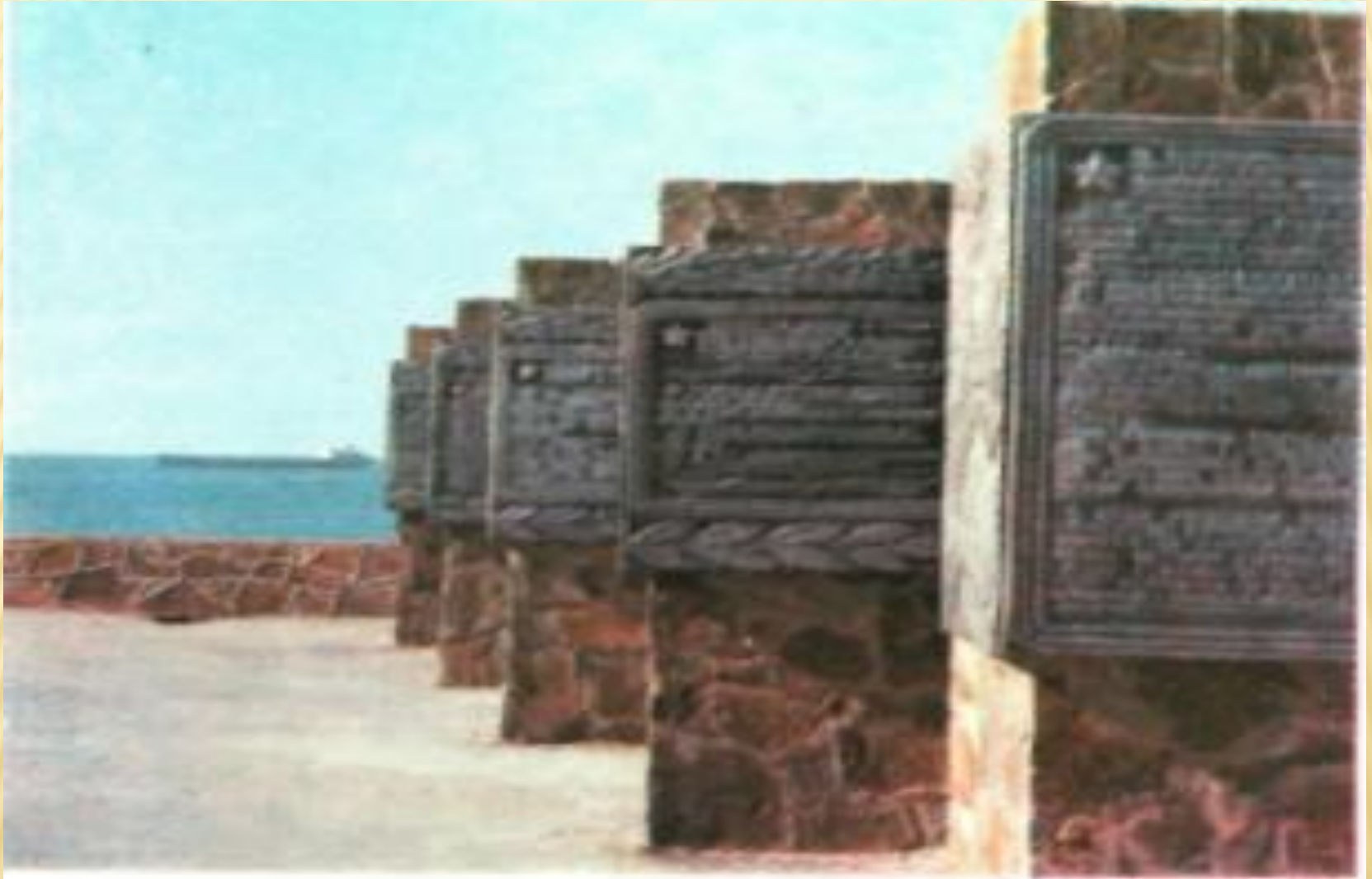
Передний край обороны у цементного завода «Октябрь».