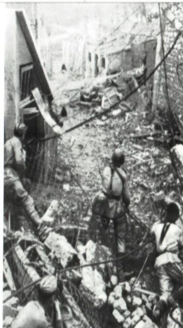
Новороссийск . Бой шёл за каждый квартал, за каждый дом.