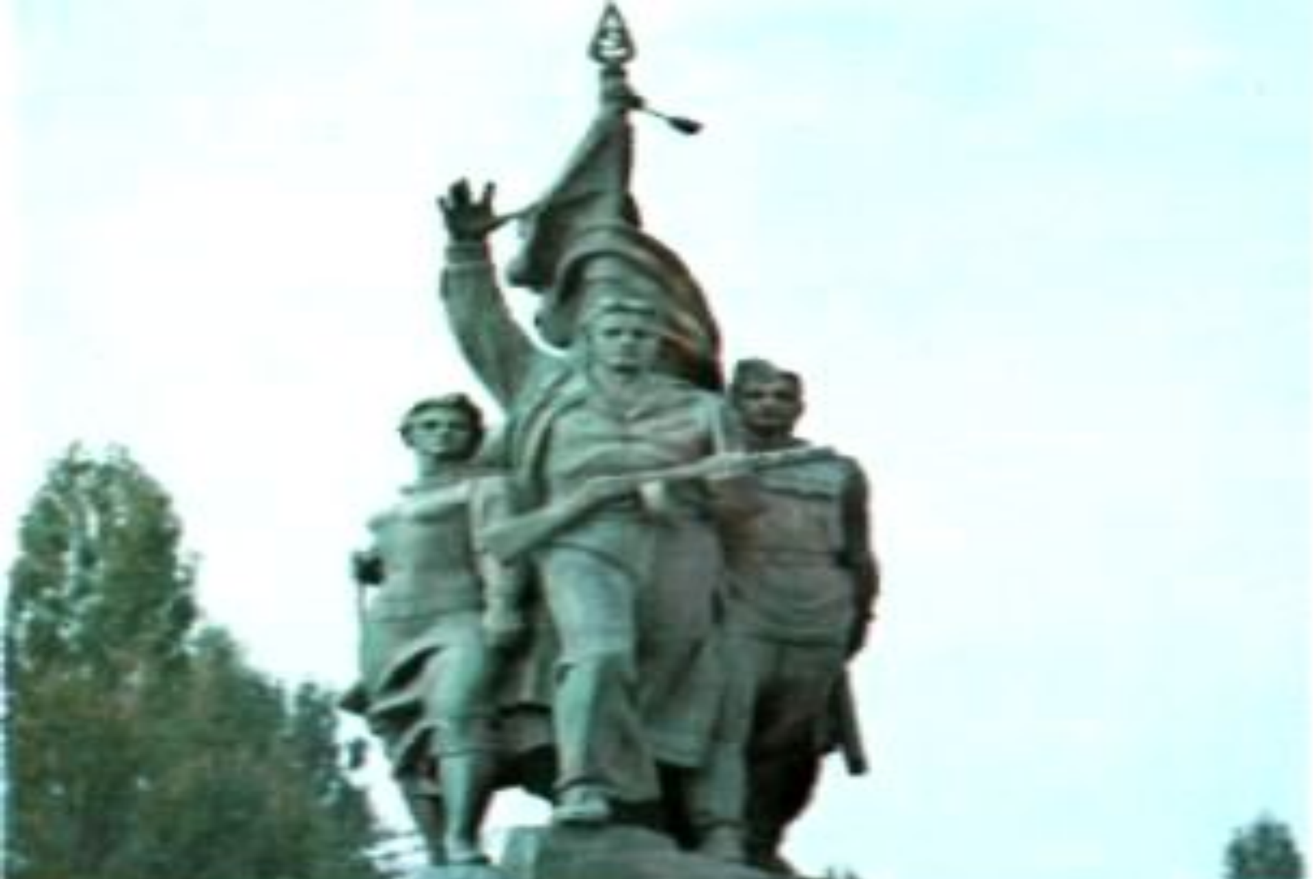
Памятник «Воинам-защитникам Новороссийска».