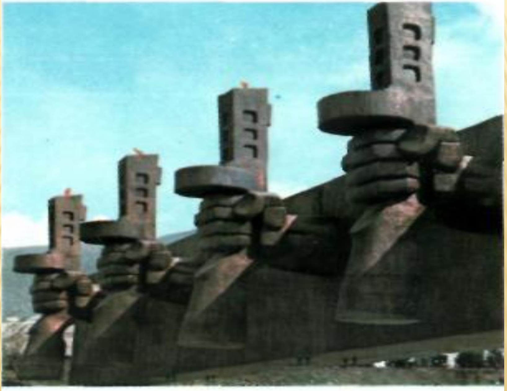
Мемориальный комплекс «Линия обороны» (фрагмент).