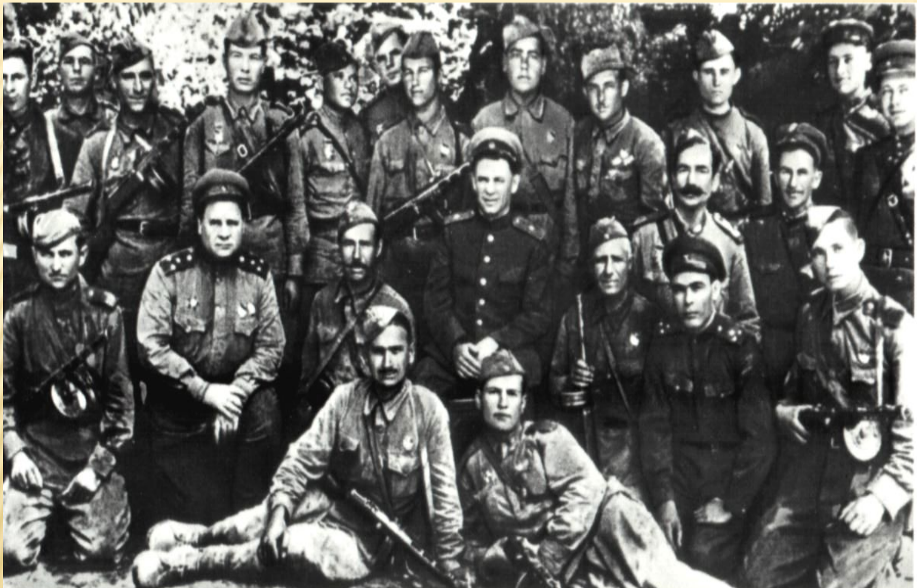
Воины 18-й армии.