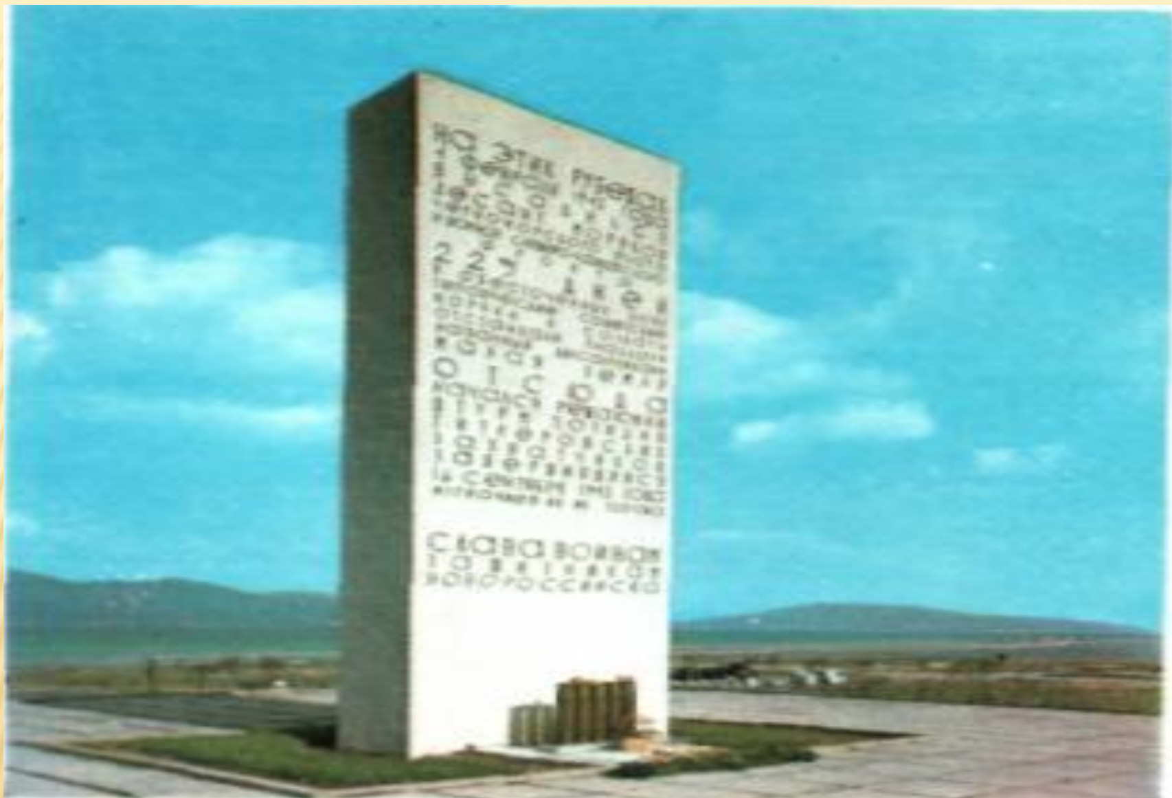
Памятник-стела на месте высадки десанта