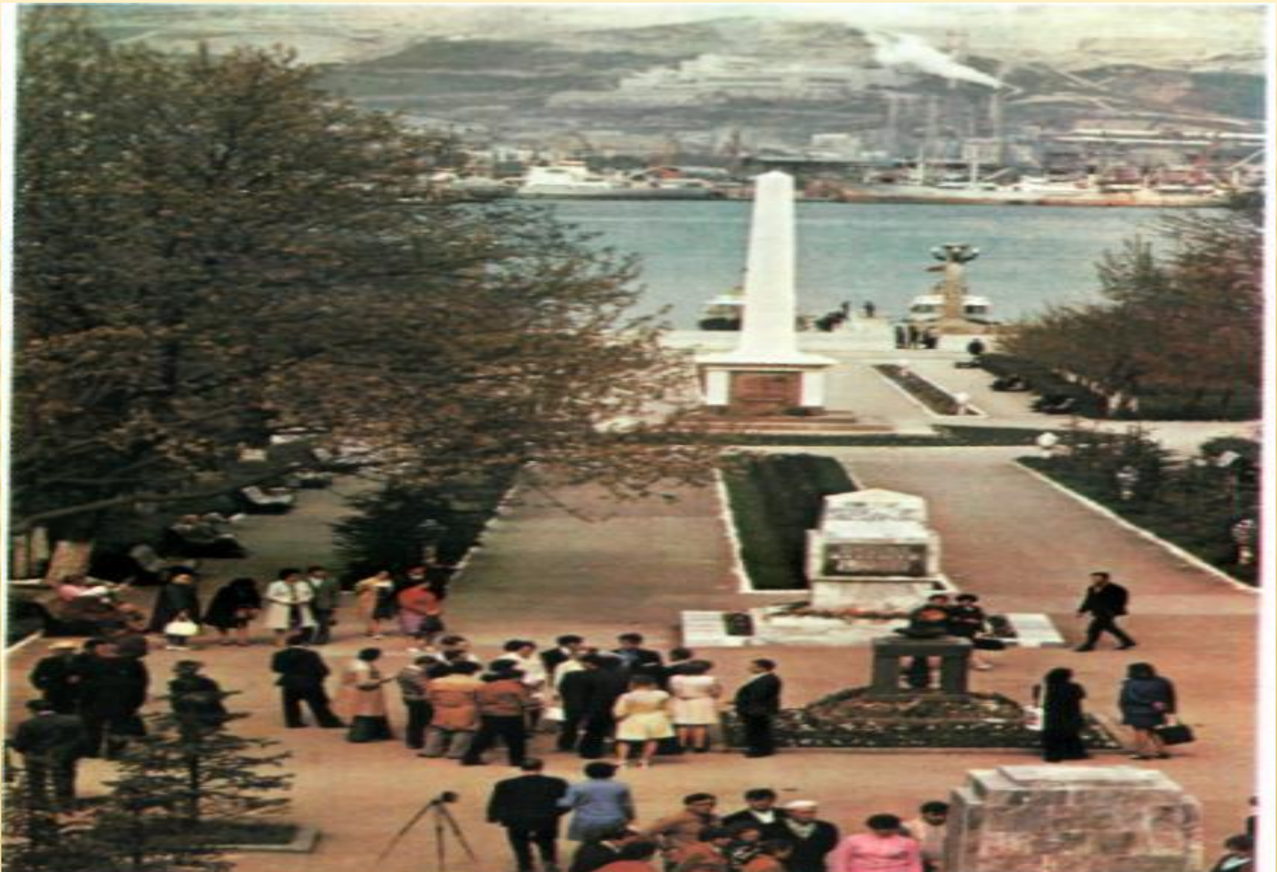
Площадь Героев в Новороссийске.