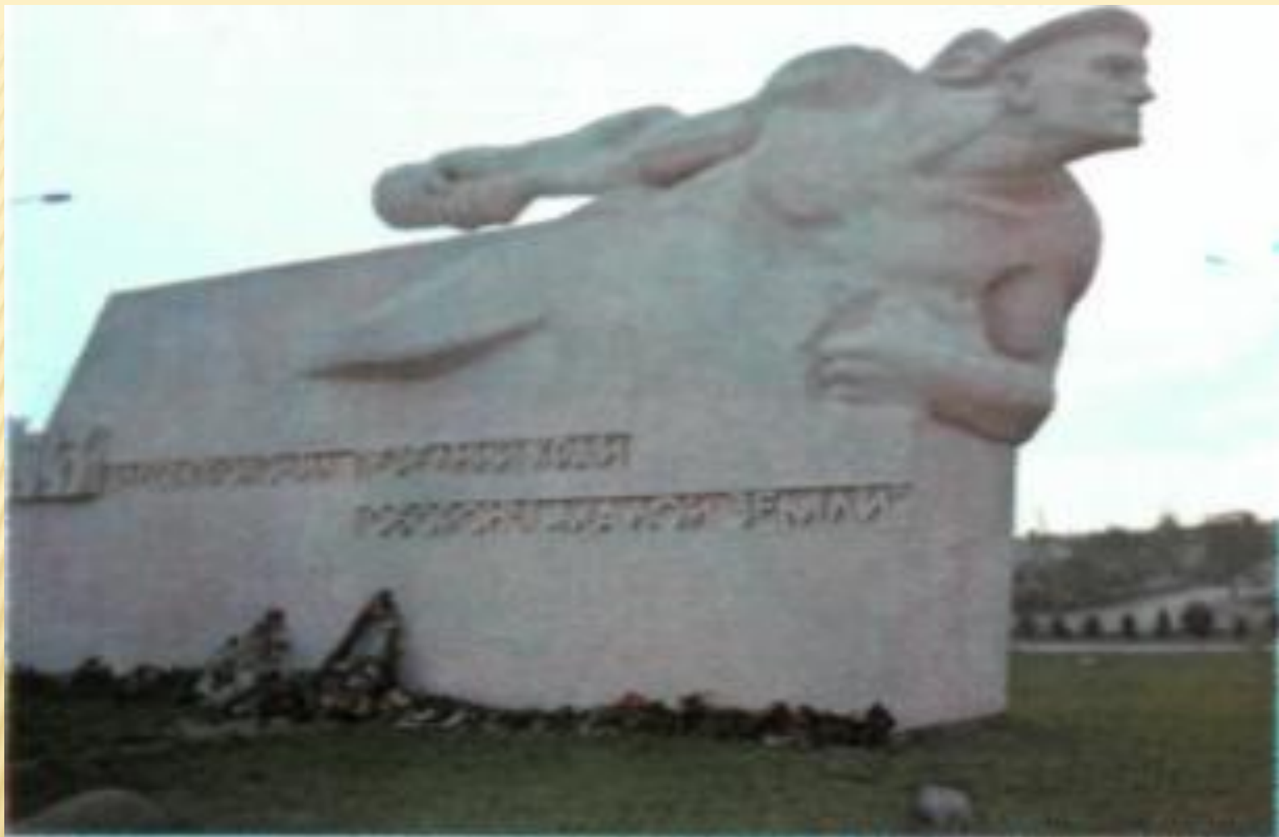
Монумент «Линия обороны»