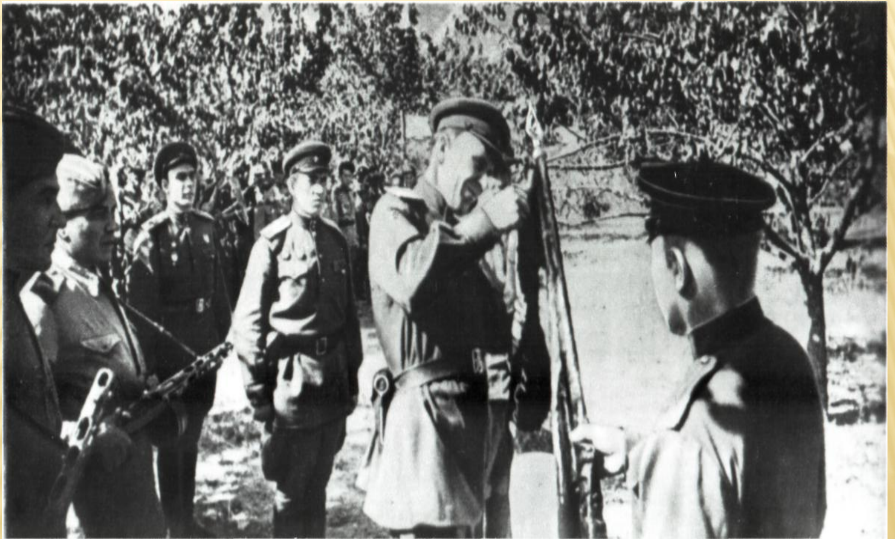
Перед десантом в Новороссийск офицеры 255-й бригады морской пехоты прикрепляют орден к знамени части .