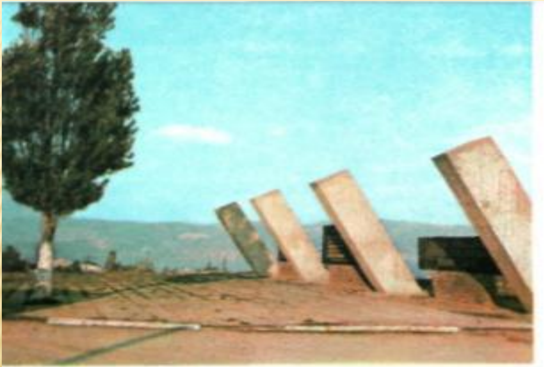
Передний край обороны Малой земли.