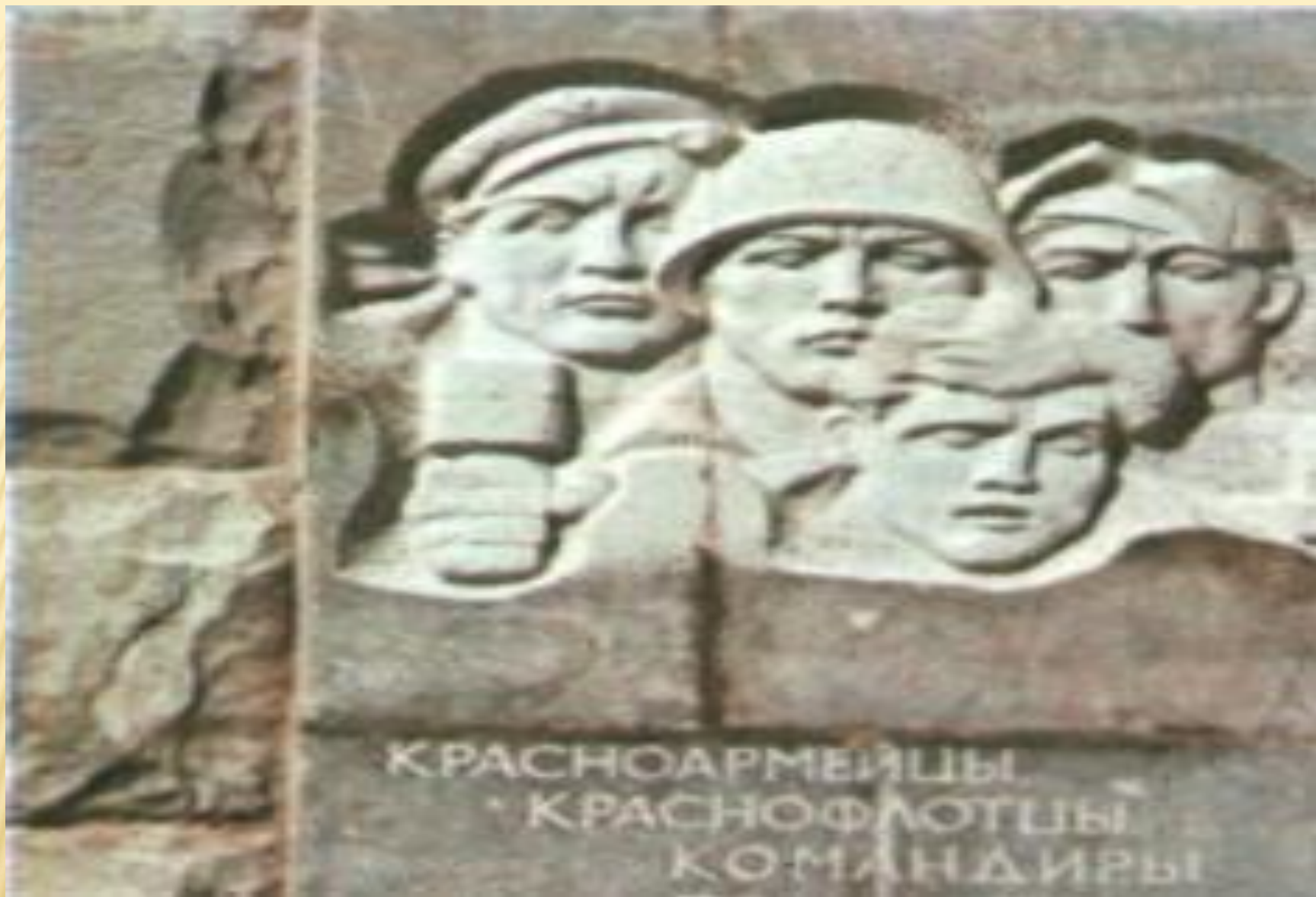
Мемориальный комплекс «Малая земля» (фрагмент).