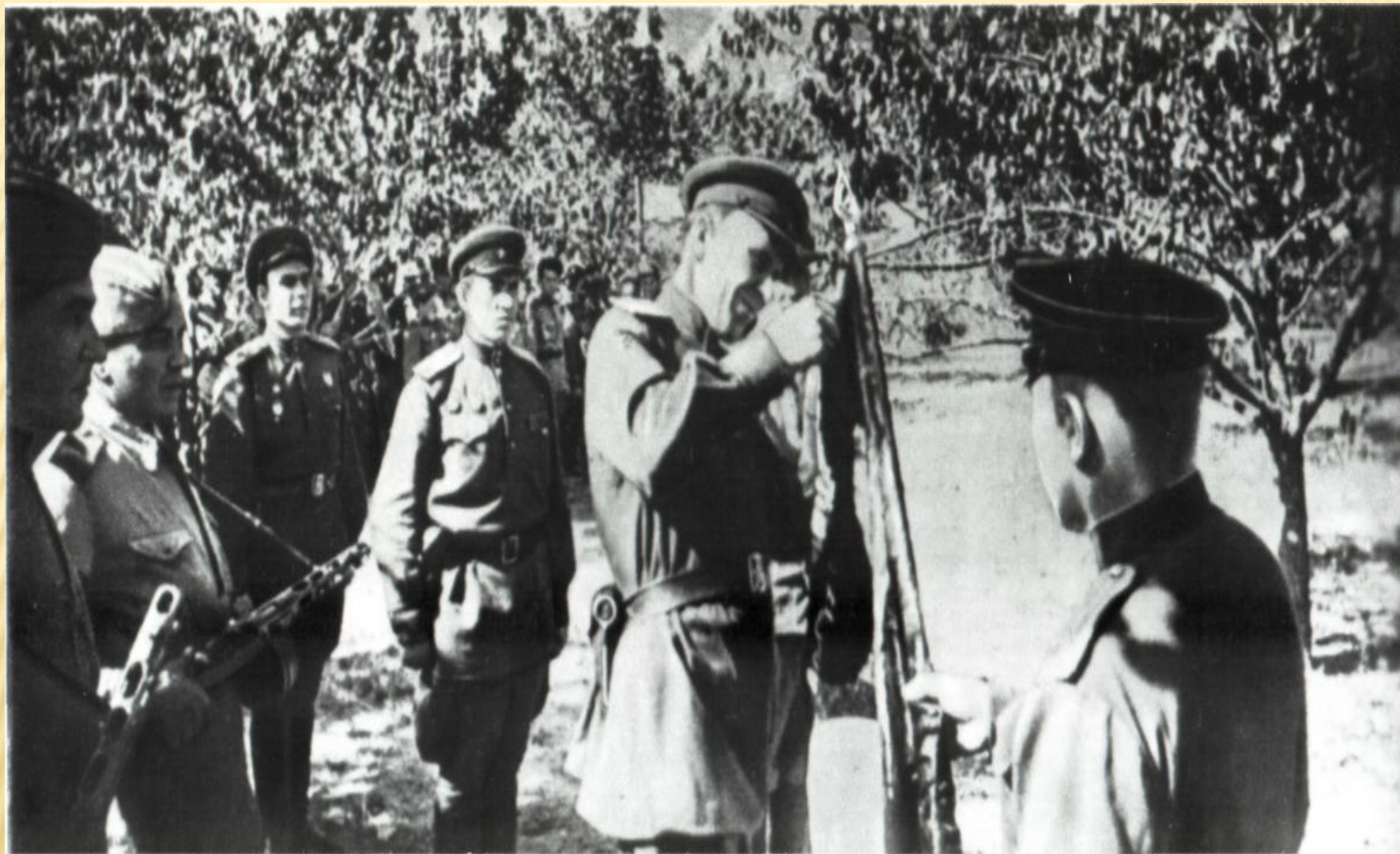
Перед десантом в Новороссийск офицеры 255-й бригады морской пехоты прикрепляют орден к знамени части .