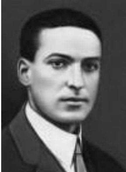
Л. С. Выготский