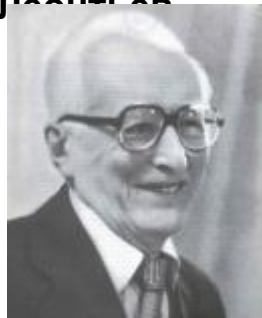
П. Я. Гальперин