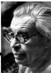
Д. Б. Эльконин