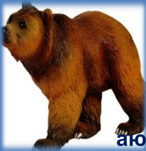
аю - медведь