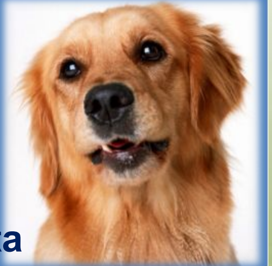
эт - собака