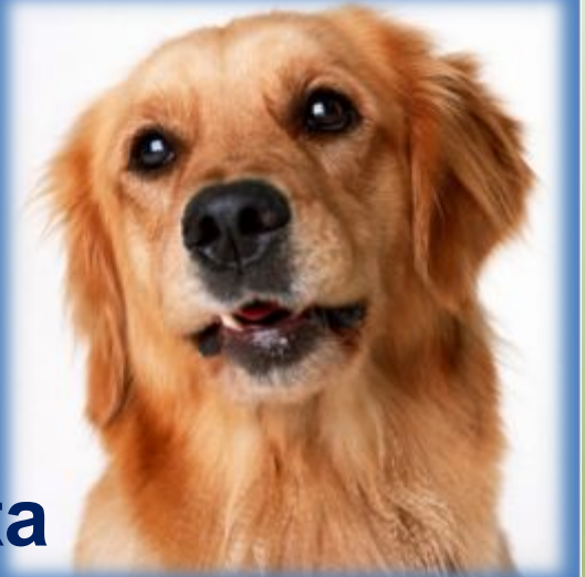
эт - собака