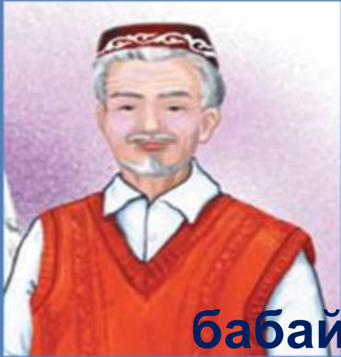
бабай - дедушка