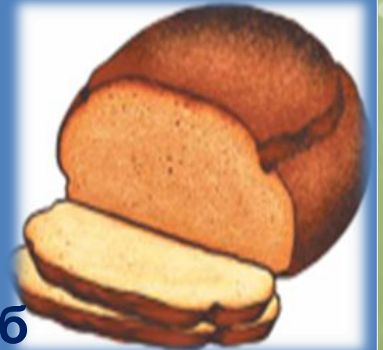
ипи - хлеб