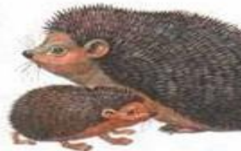
еж с ежонком