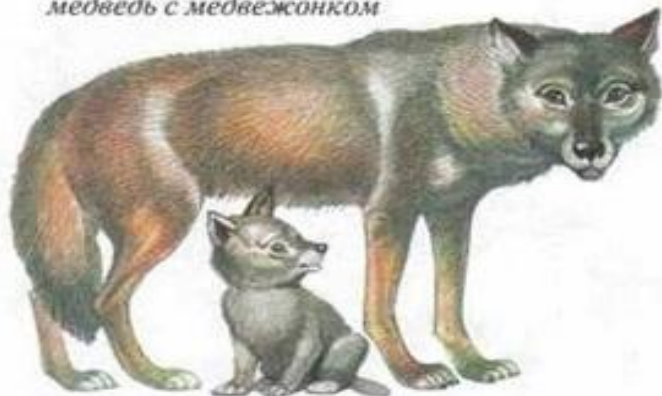
волк с волчонком