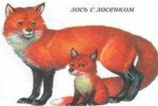
лиса с лисенком