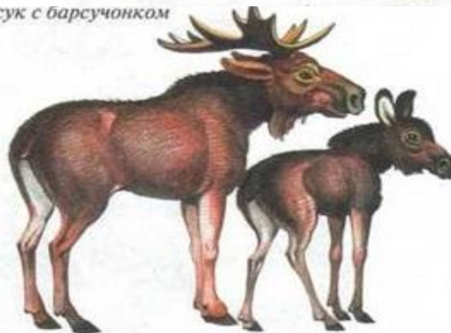
лось с лосенком