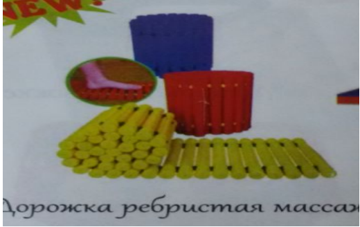
Дорожка ребристая массаж