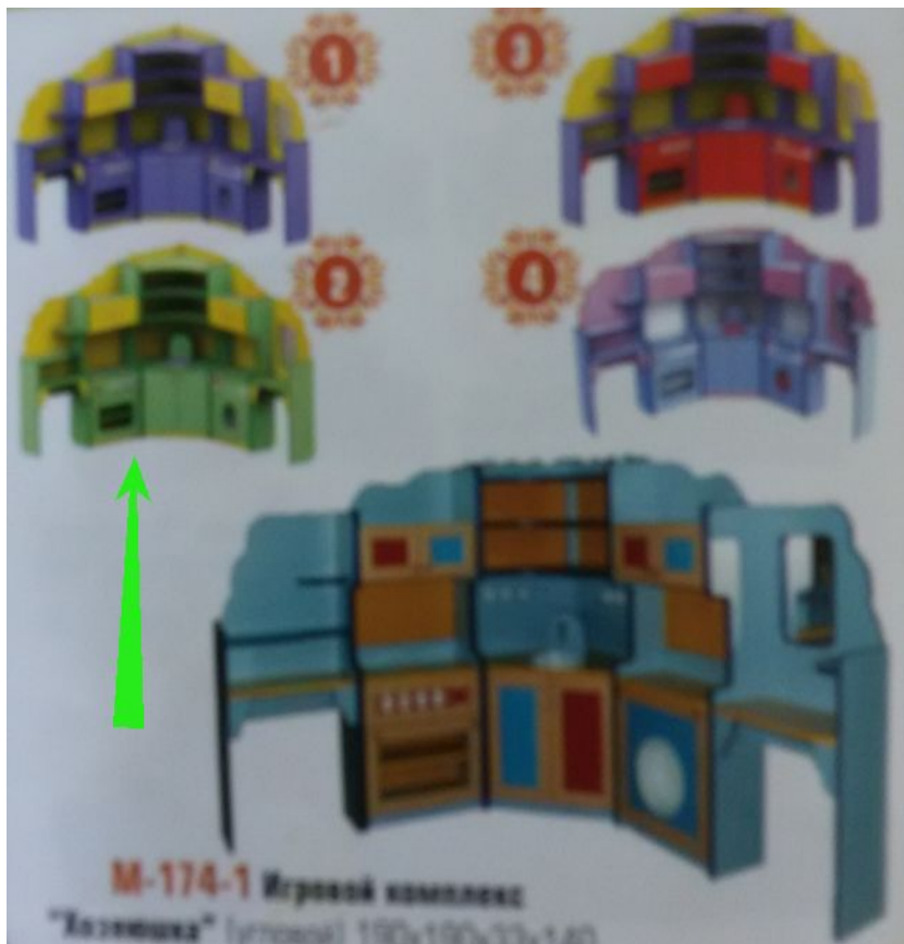
M-174-1 Игровой комплект "Кухонка" (размер) 190x190x33x140