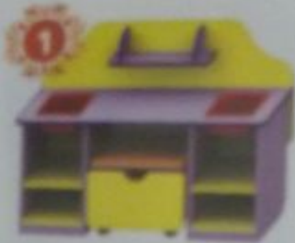
M-223 Стол дидактический малый с наполнением 107x47x86.

Необходимо указывать название обивочного материала.