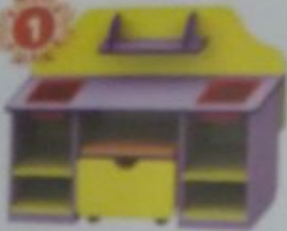
M-223 Стол дидактический малый с наполнением 107x47x86.

Необходимо указывать название обивочного материала.