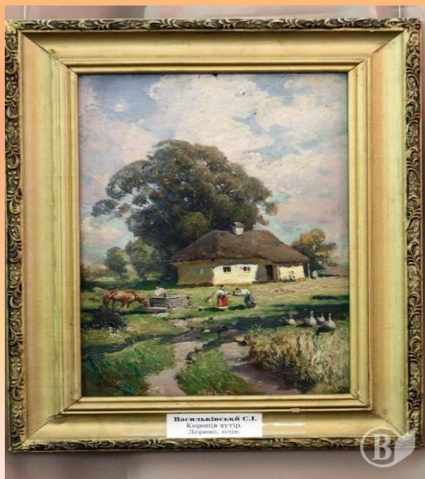
Васильківський С.І. Коропів хутір. Дерево, олія