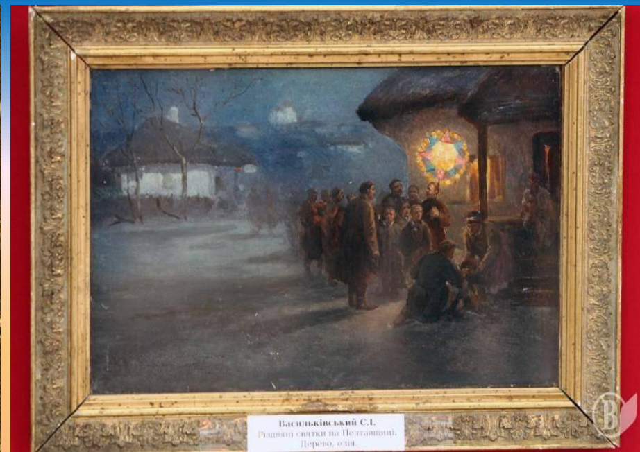
Васильківський С.І. Родивий святки на Полтавині. Дерево, олія