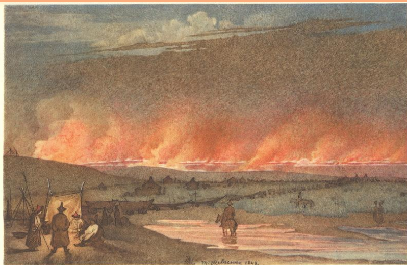
2. ПОЖЕЖА В СТЕПУ. Акварель. [Ш. р. 12X] 1848.