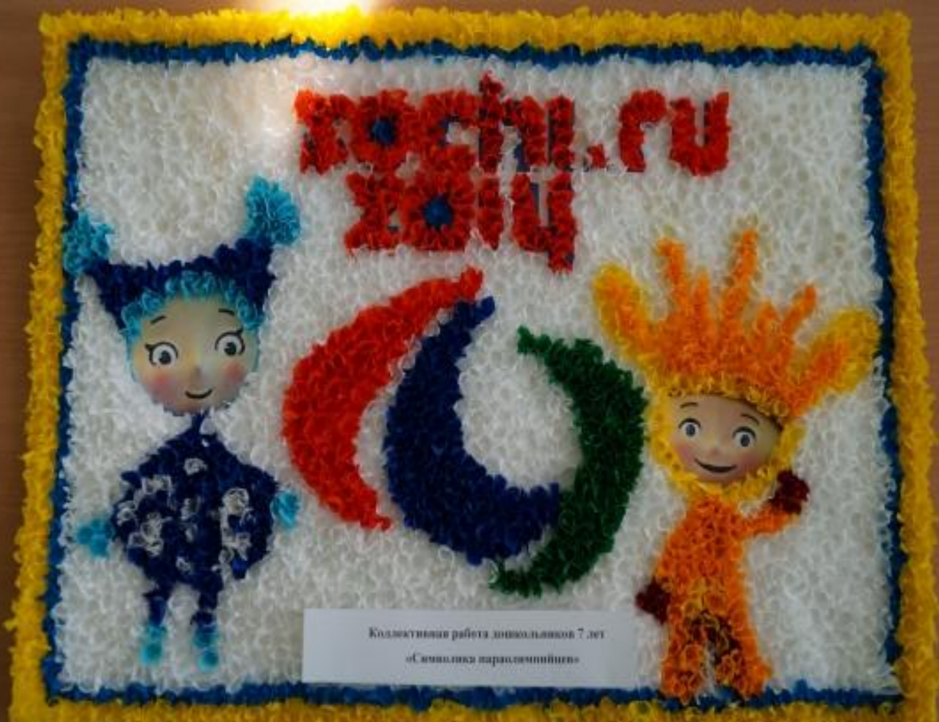
Коллективная работа дошкольников 7 лет «Семилетка параллельного»