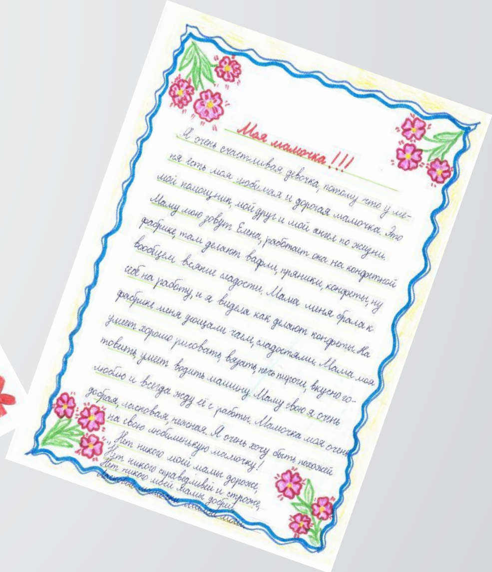
Доброе слово о маме