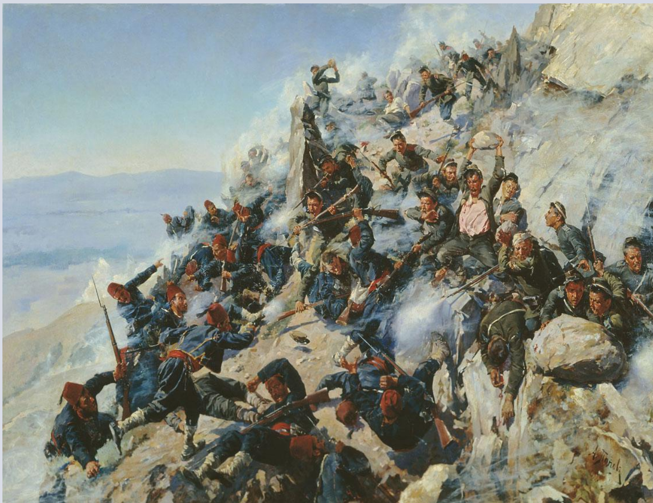
Вторая битва при Шипке