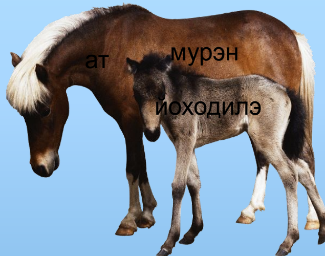
ат мурэн иоходилэ