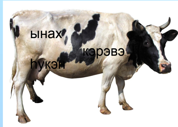
ынах кэрэвэ пукэн