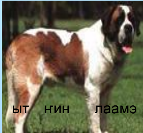
ЫТ НИН лаамэ