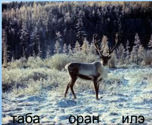
таба оран илэ