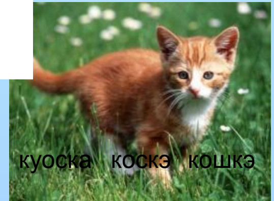
куоска коскэ кошкэ