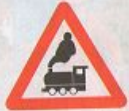
Железнодорожный переезд без шлагбаума