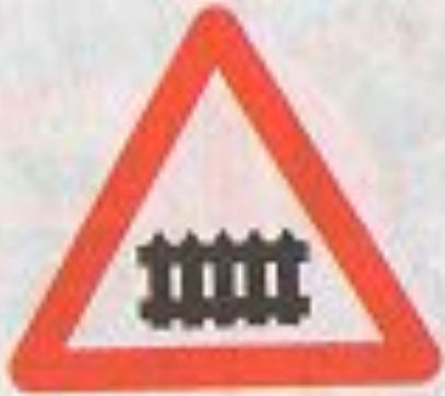
Железнодорожный переезд со шлагбаумом