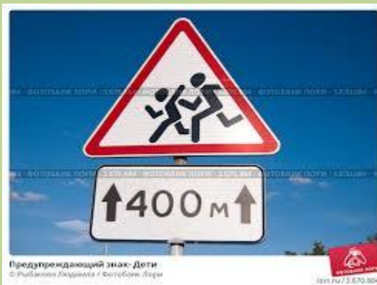
Предупреждающий знак- Дети