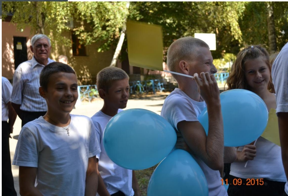
Парад до Дня фізичної культури та спорту