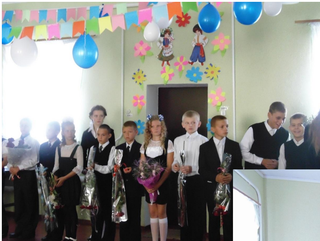
Участь у традиційних шкільних святах