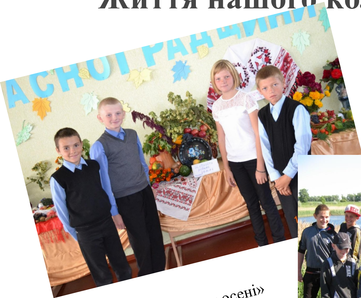
Виставка «Дари осені»