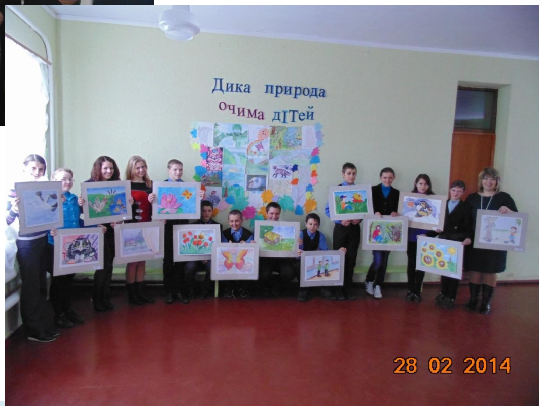
Виставка малюнків «Дика природа очима дітей»