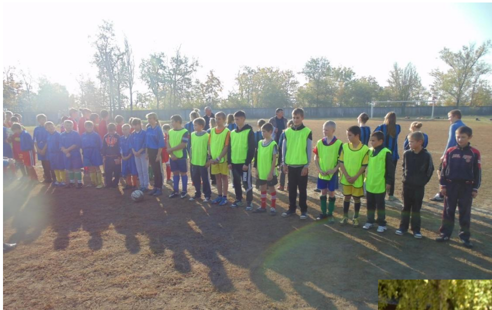
Чемпіонат з футболу