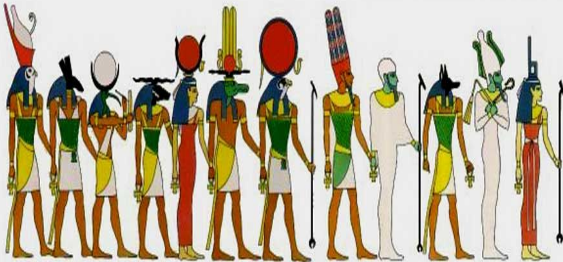
Гор Сет Тот Хнум Хатор Собек Ра Амон Пта Анупис Осирис Исида