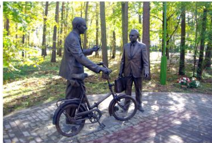
3. Памятник Б.М. Понтекорво и В.П. Желепову