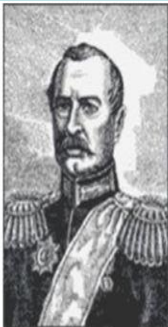
Антон Головатый 1732 — 1797