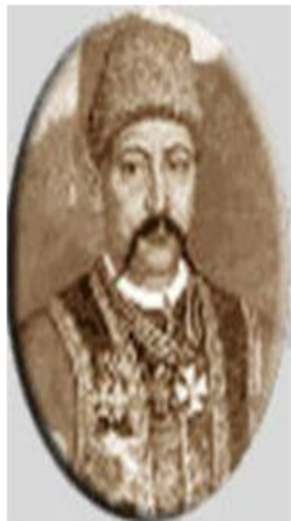
Захарий Чепега 1726 — 1797