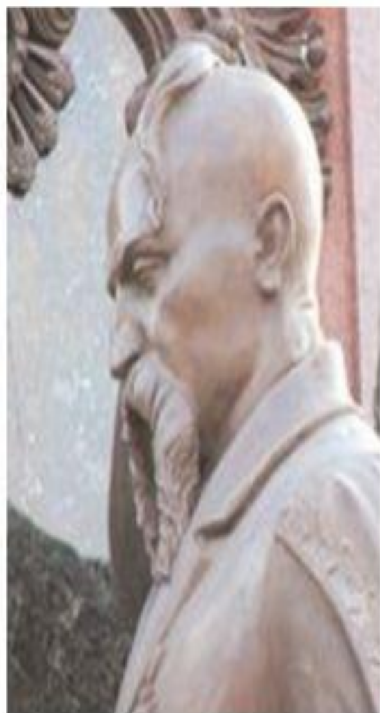
Сидор (Савва) Белый 1730-е — 1788