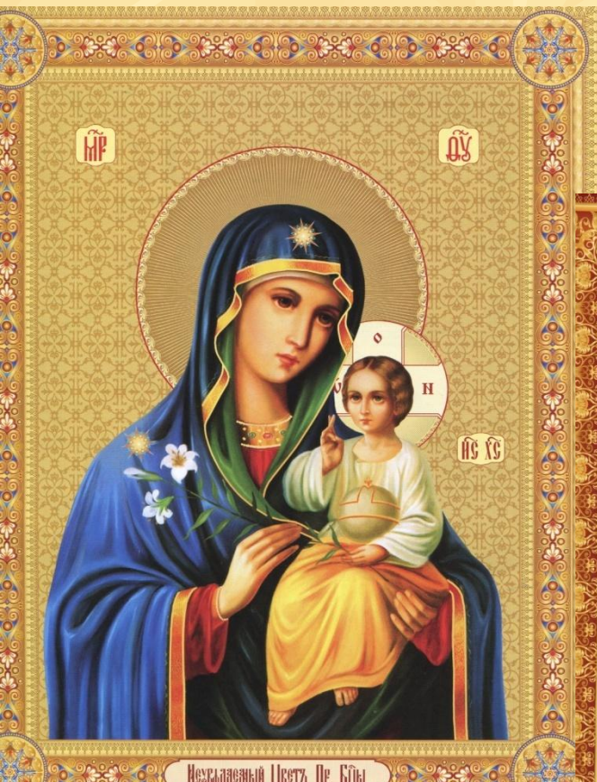
Незлобивый Цветы Пр. Блвы