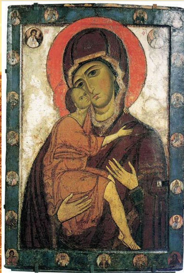
Богоматерь Умиление Белозерская. Первая пол. 13 в.