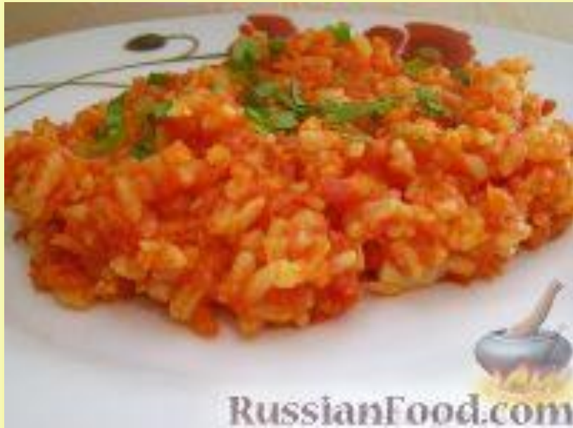
Рис с овощами, плов, рисовые каши