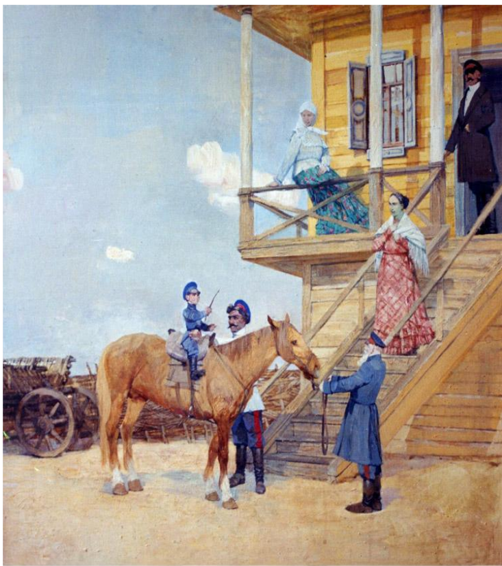
"Постриги". С. Гавриляченко. 2000 год.