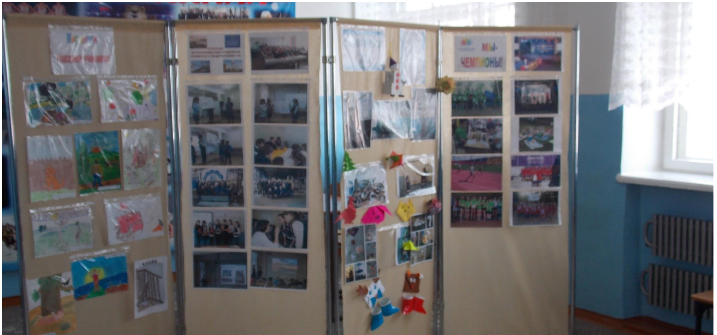
Выставочная зона для предъявления результатов внеурочной деятельности учащихся МБОУ СОШ 14.