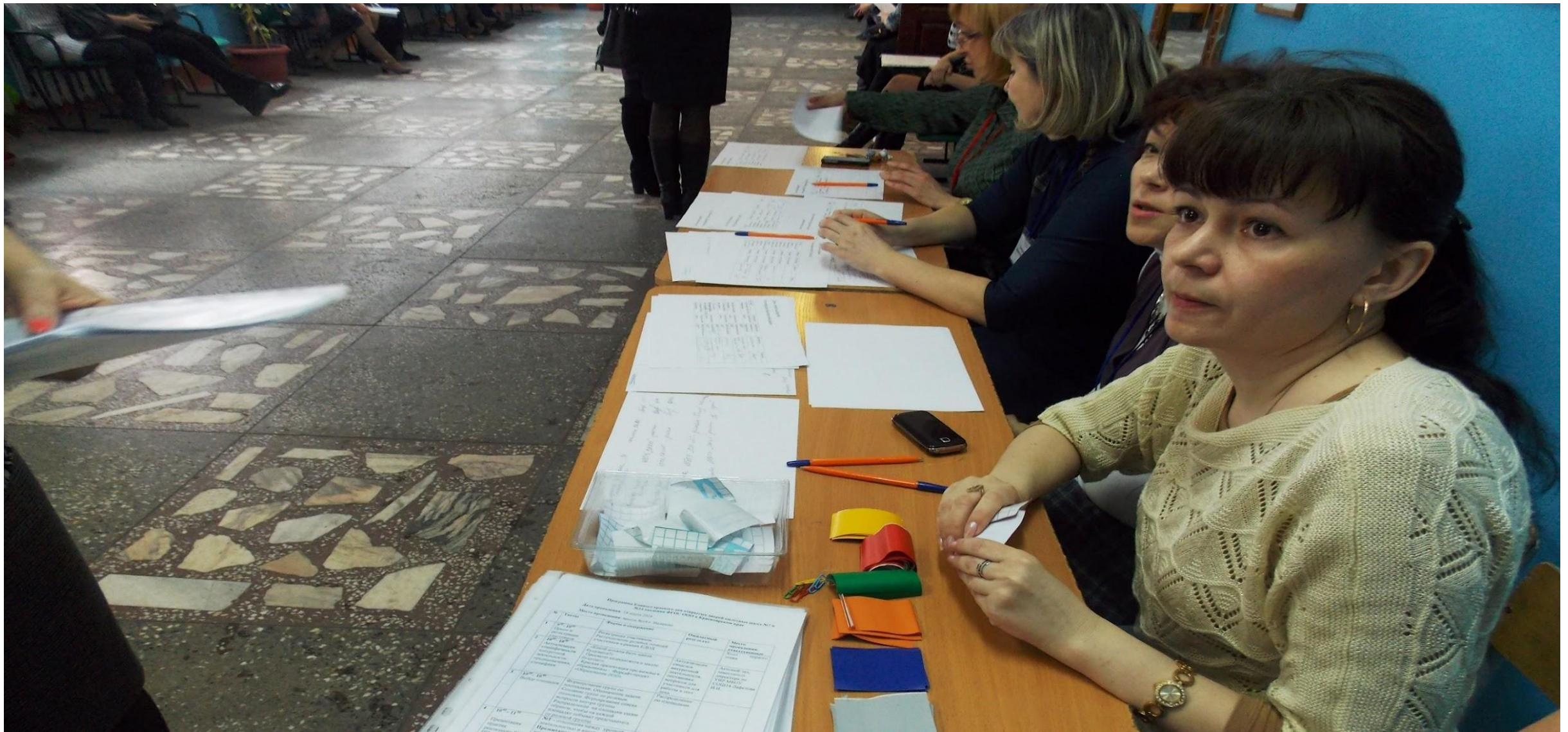
Регистрация участников ЕДОД по единой форме. Выдача жетонов, определяющих ролевые позиции, рамочных материалов.