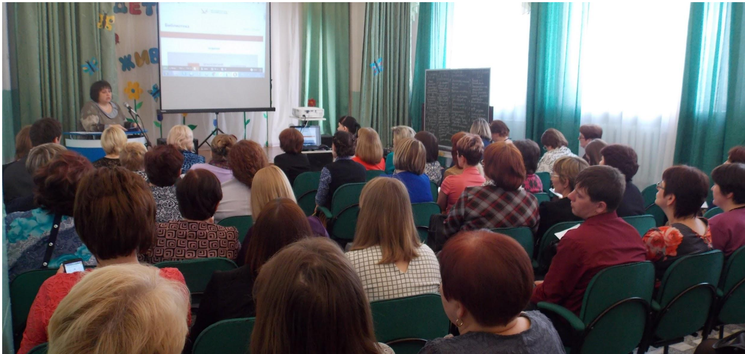
Представление ресурсного центра по ФГОС.