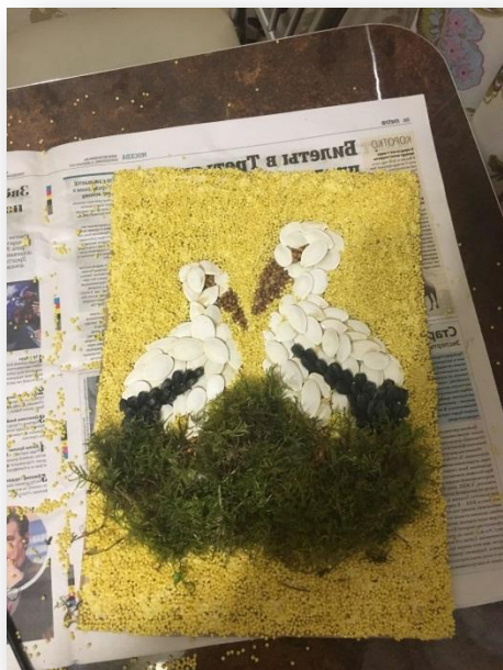
4.1. С помощью клея и мха делаем гнездо