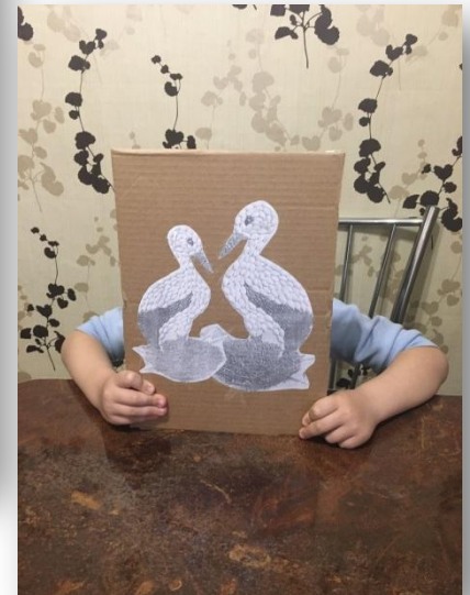
1.3. Эскиз готов к работе