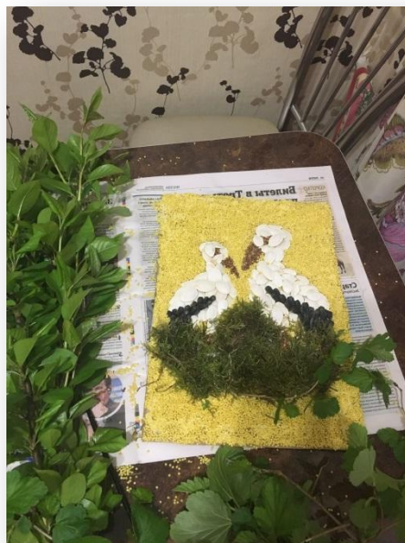
4.2. С помощью клея и веточек обделываем гнездышко