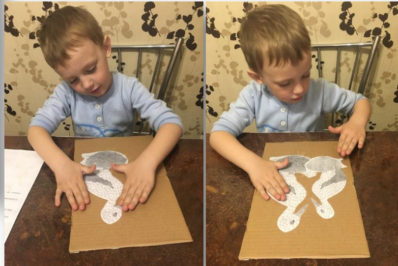
1.2. С помощью ПВА клея наносим трафареты на картон