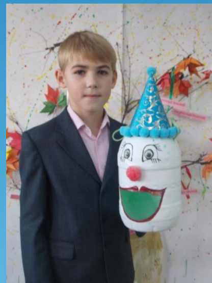
Самая оригинальная кормушка