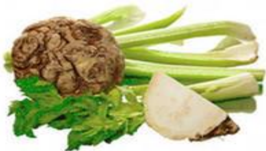
сельдерей и капуста

Круглый год необходимо употреблять в пищу капусту в свежем или квашеном виде. Заболела голова приложите капустный лист и боль уйдет.