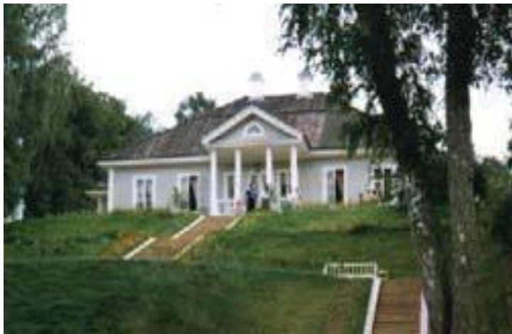
Михайловское. Дом Пушкиных. Северный фасад.

"ПРИВЕТСТВУЮ ТЕБЯ, ПУСТЫННЫЙ УГОЛОК, ПРИЮТ СПОКОЙСТВИЯ, ТРУДОВ И ВДОХНОВЕНИЯ..." ПИСАЛ ПОЭТ ОБ ЭТИХ МЕСТАХ В 1819 ГОДУ. УЧИТЫВАЯ ОГРОМНОЕ КУЛЬТУРНОЕ И ИСТОРИЧЕСКОЕ ЗНАЧЕНИЕ ПУШКИНСКИХ МЕСТ, 17 МАРТА 1922 ГОДА СОВЕТСКОЕ ПРАВИТЕЛЬСТВО ОБЪЯВИЛО ИХ ЗАПОВЕДНИКОМ.