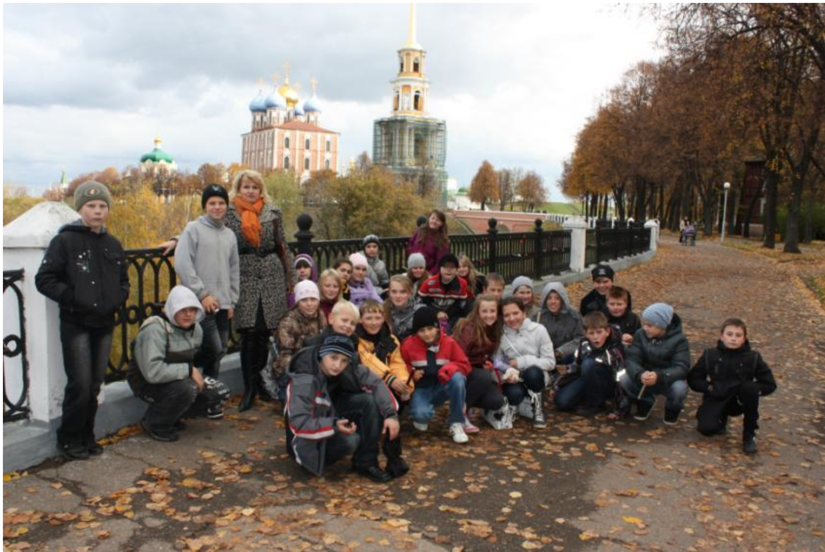
РЯЗАНЬ. КРЕМЛЬ. НАБЕРЕЖНАЯ РЕКИ ТРУБЕЖ