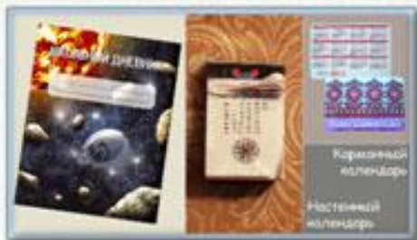
Карманный календарь Настенный календарь