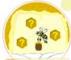
Упражнение из рабочей тетради