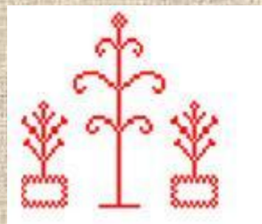
Символ девушки - березки