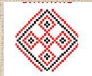
Символ крепкой семьи