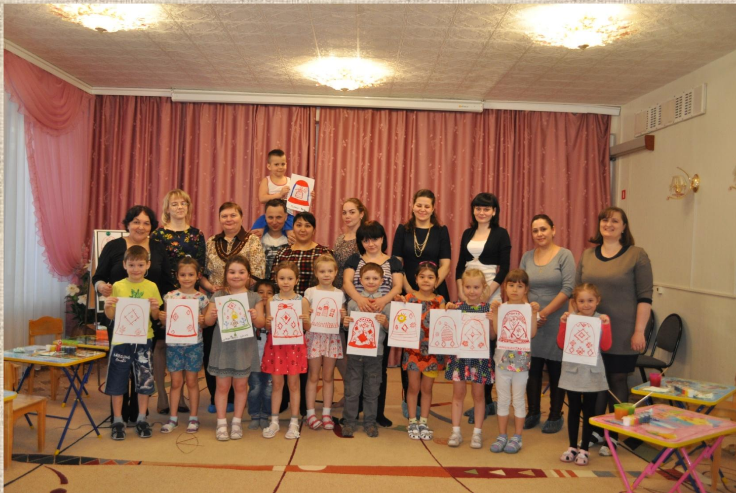
Творческая работа «Роспись колокольчика белорусским орнаментом»