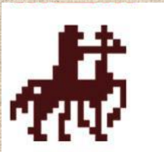
Ярило на коне