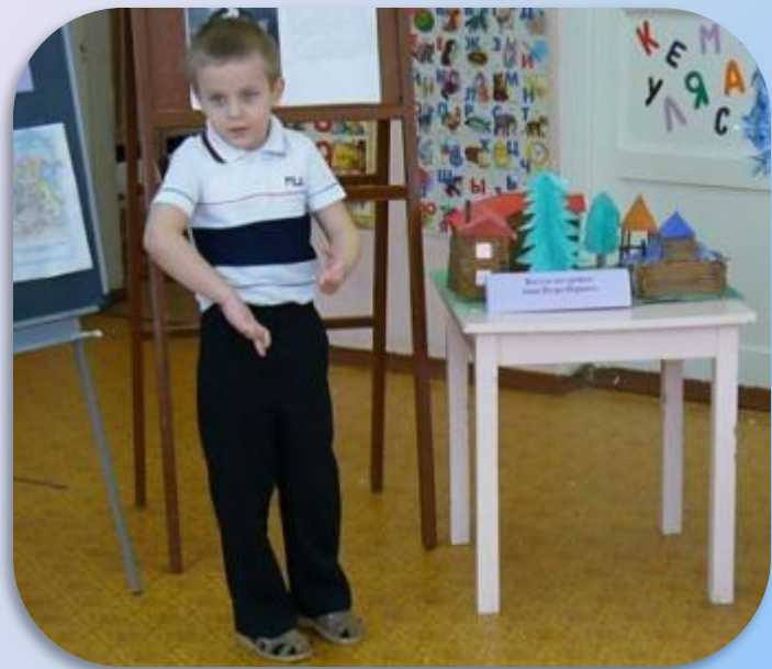
Макет эпохи Петра 1