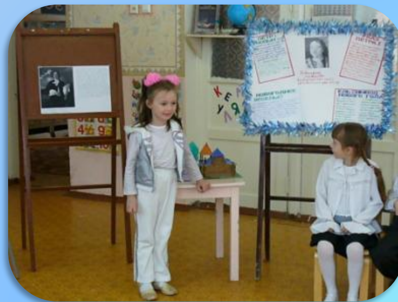
Указы Петра 1