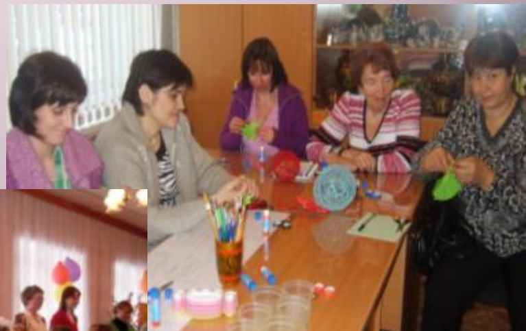
Взаимодействие педагога с психологическим коллективом