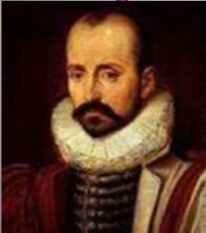
МАШЕЛЬ де МОНТЕНЬ 1533 – 1592гг.