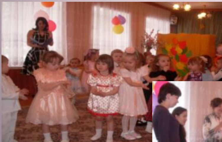
Взаимодействие педагога с детьми