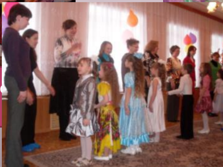
Взаимодействие педагога с родителями