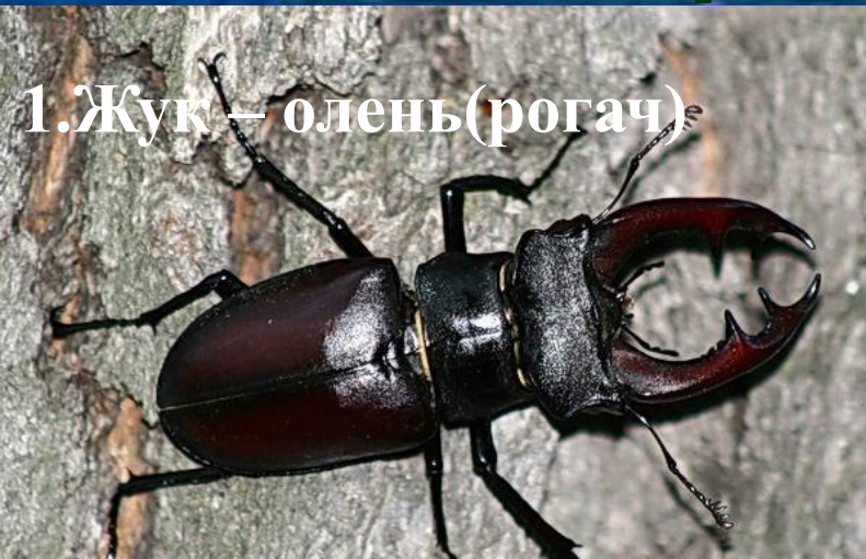
1. Жук – олень (рогач)