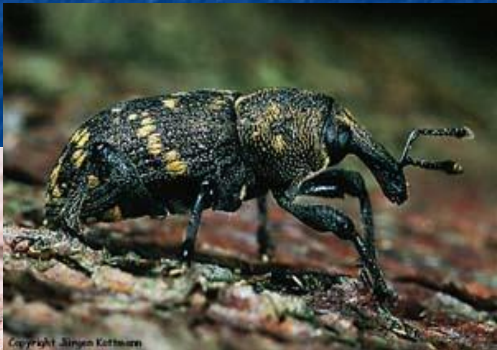
3. Жук – сосновый слоник