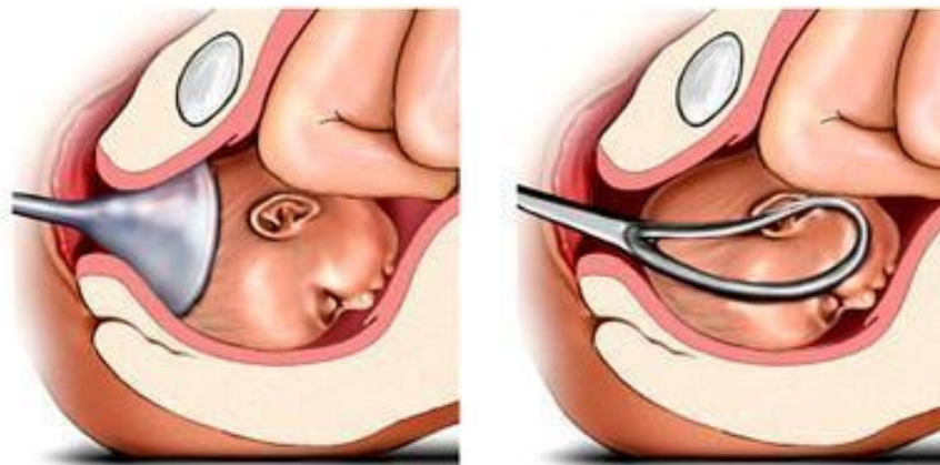
Использование щипцов и вакуум экстрактора