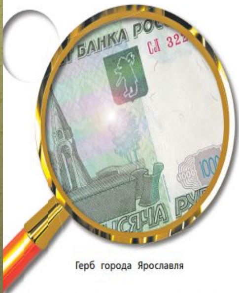
Герб города Ярославля

Защитная блестящая нить и три рельефные полоски