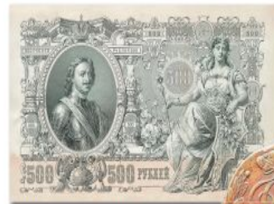
500 рублей (1912 г.)

Появление ассигнационных рублей было вызвано большими расходами правительства на военные нужды. Серебра в казне не хватало, поскольку все расчёты с заграницей велись только в серебряных и золотых монетах. А медные деньги были очень тяжёлыми. Так, чтобы перевезти 500 рублей медными монетами, требовалась отдельная телега.