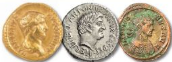
Золотой ауреус, серебряный денарий и медная монета Римской империи

Мне оставалось только согласиться с ним.