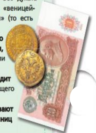
Петровские червонцы и 10 рублей СССР

В обиходе червонцами называют банкноты номиналом десять единиц (например, гривен, евро и т. д.).