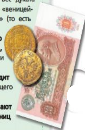
Петровские червонцы и 10 рублей СССР

В обиходе червонцами называют банкноты номиналом десять единиц (например, гривен, евро и т. д.).