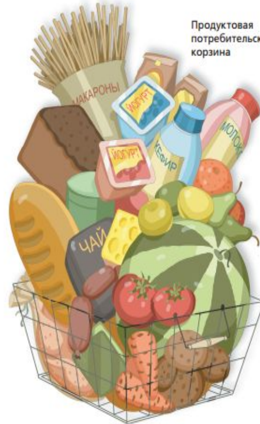
Продуктовая потребительская корзина

Для определения необходимой для жизни минимальной суммы денег устанавливается прожиточный минимум. Иначе говоря, потребительская корзина. Так называют стоимость минимального набора продуктов питания, товаров и услуг, чтобы человек мог свести концы с концами.