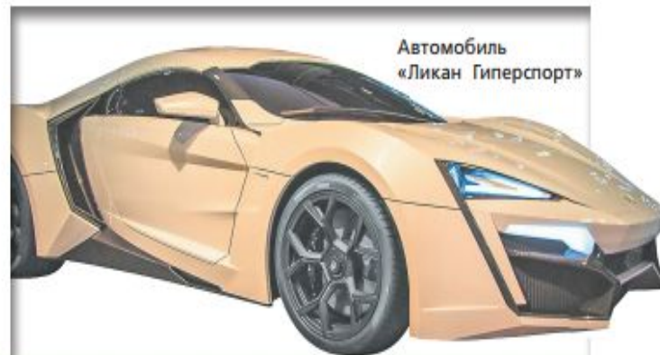
Автомобиль «Ликан Гиперспорт»