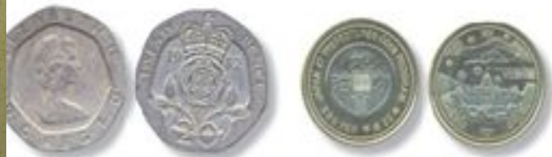
Монета 20 пенсов

Посмотри, например, на обе стороны английской монеты 20 пенсов и японской мо-