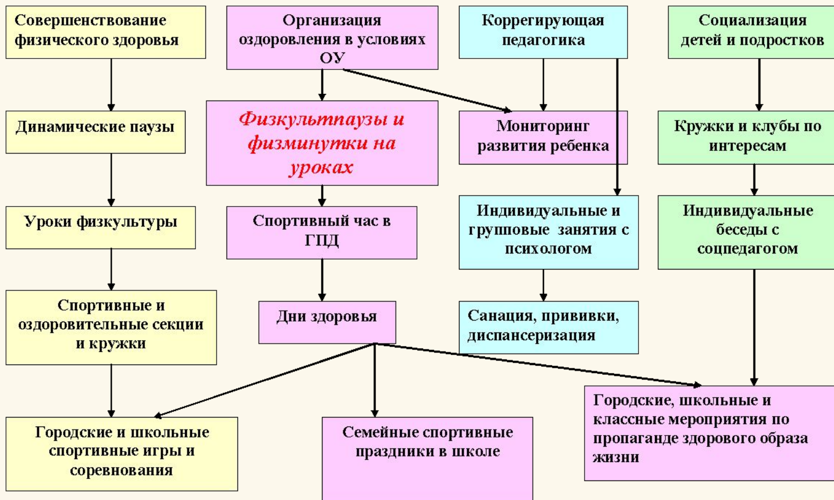
Схема оздоровительной работы учащихся 1-4 классов