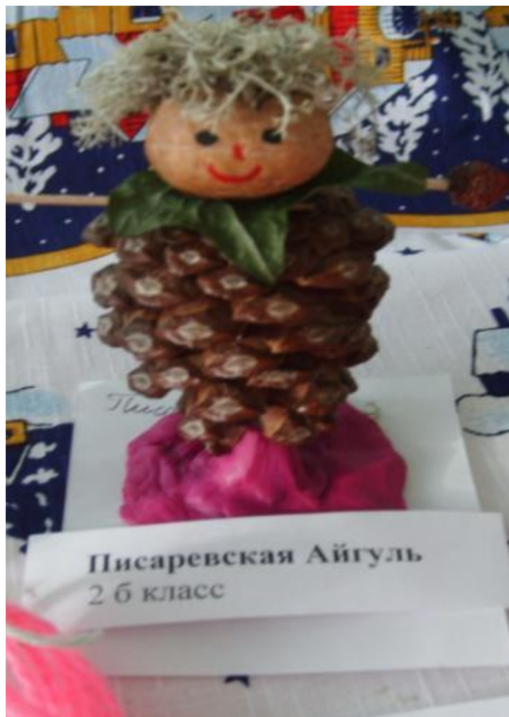
Писаревская Айгуль 2 б класс