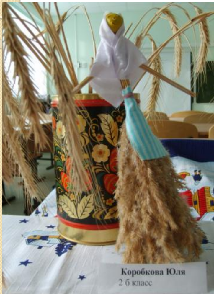
Коробкова Юля 2 б класс