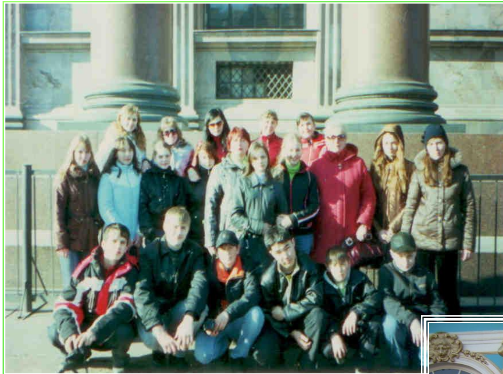
Экскурсия в город Санкт-Петербург, март 2007 г.