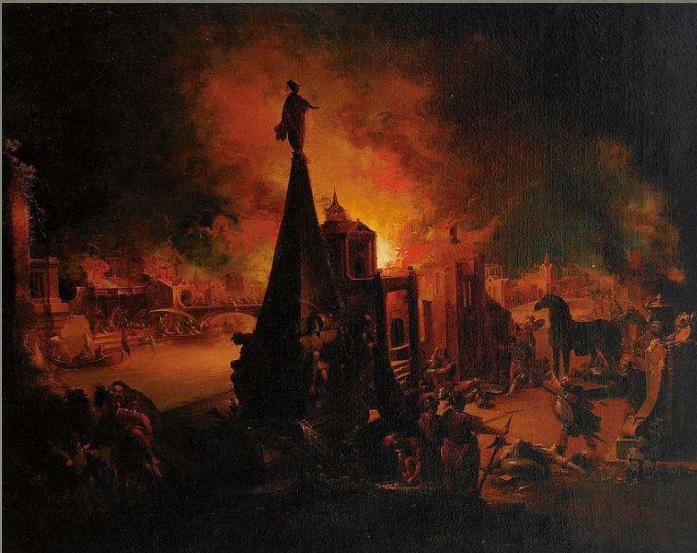
Картина Иоанна Георга Траутманна «Падение Трои»