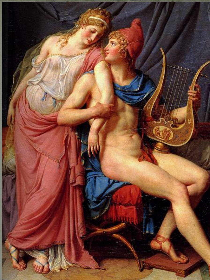
Елена Прекрасная и Парис. Давид, Жак Луи, 1788, Лувр, Париж