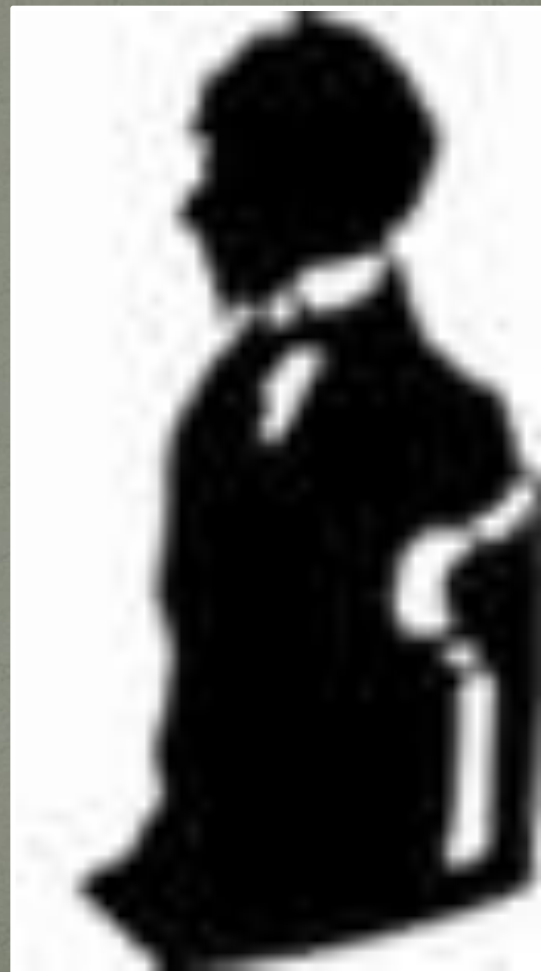
Силуэт работы Е. Кругликовой