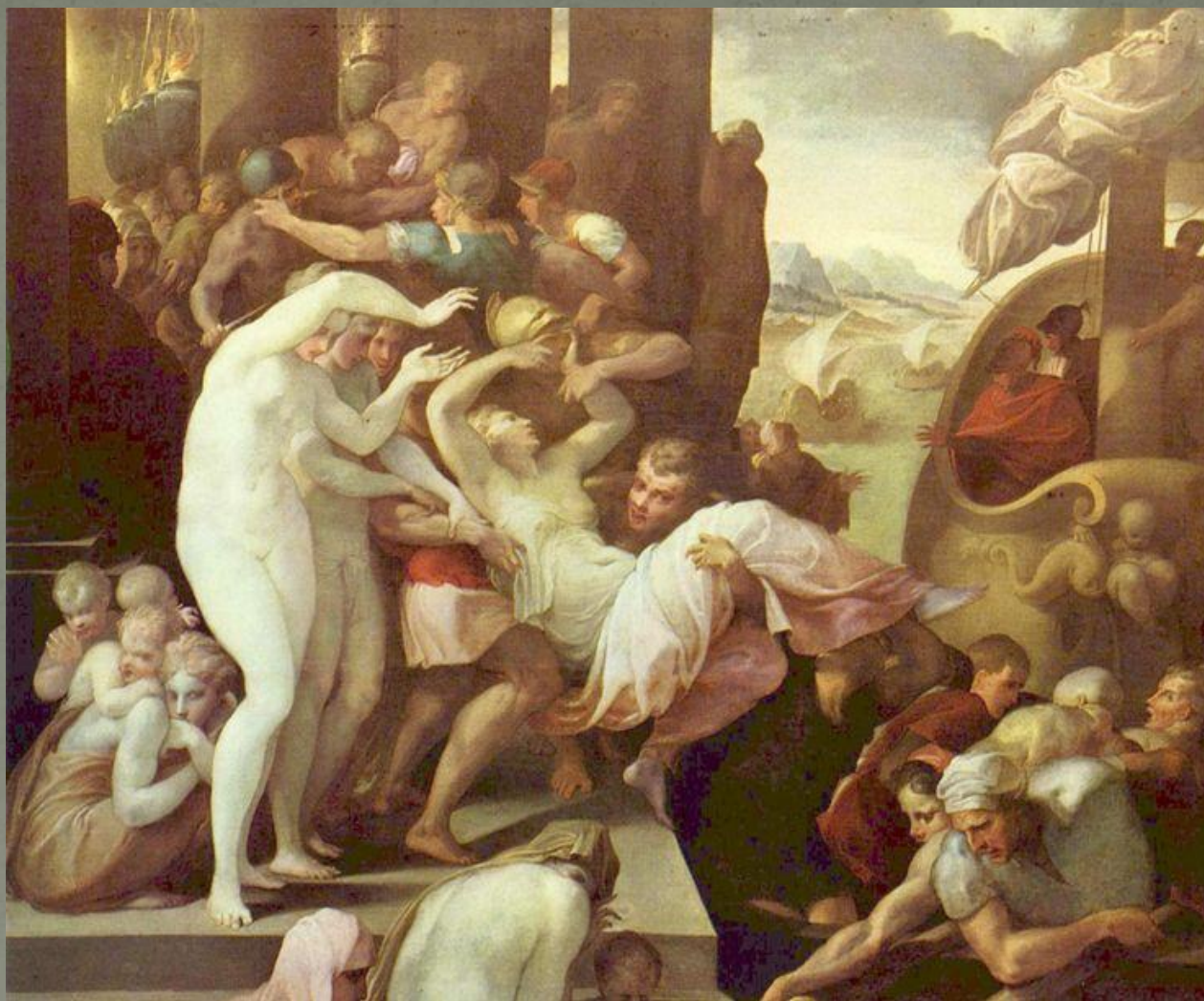
Франческо Приматиччо Похищение Елены, 1530-1539