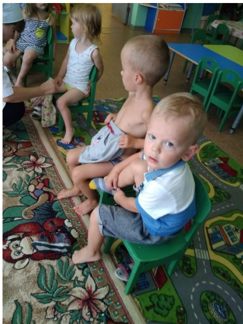
Одевание и раздевание