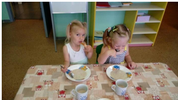
Навык самообслуживания в еде