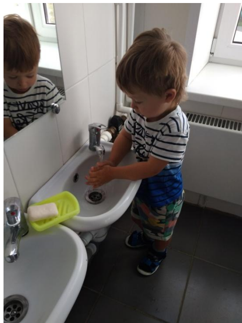
Мытьё рук и умывание