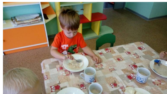
Навык правильно держать ложку