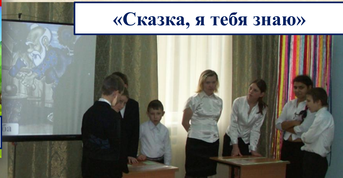
«Сказка, я тебя знаю»