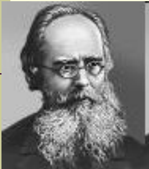
Ф. И. Буслаев