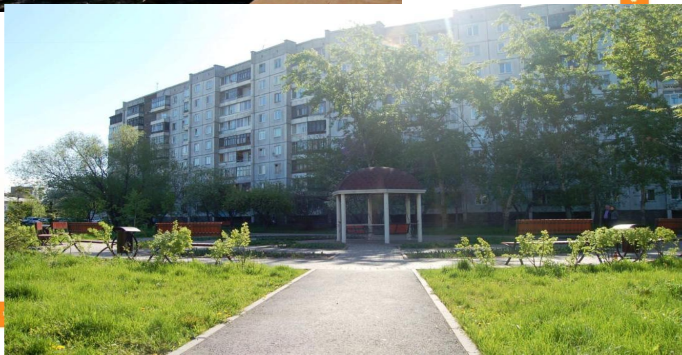
Сквер на ул. Республики