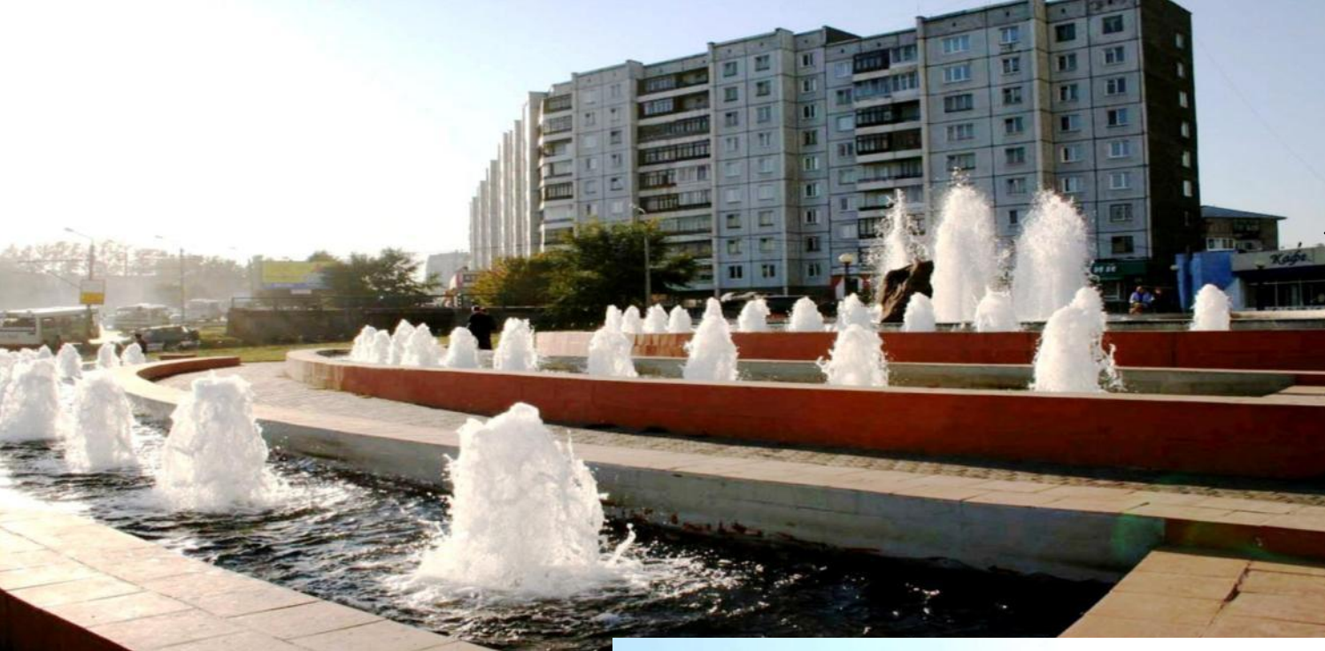
Фонтан «Лунный свет» на ул. Копылова