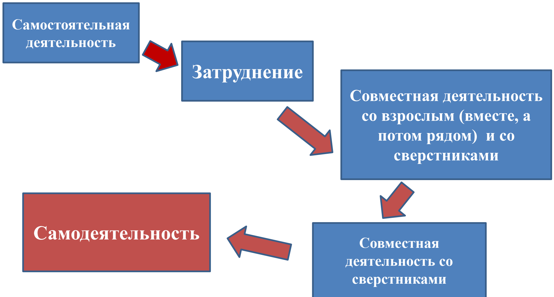
Схема развития любого вида деятельности